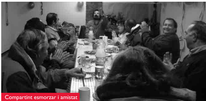
Compartint esmorzar i amistat