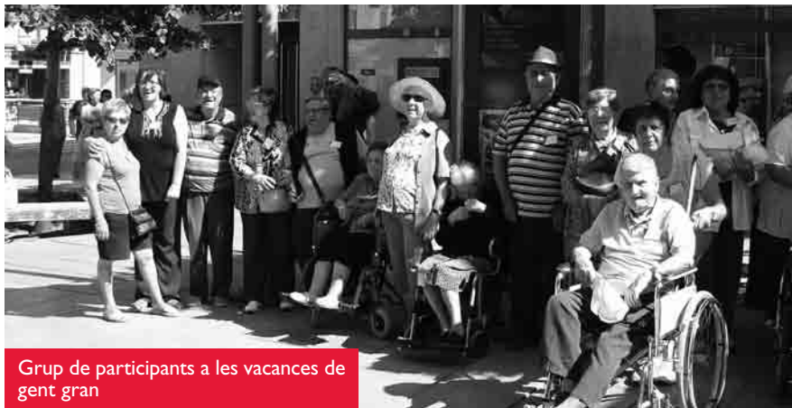
Grup de participants a les vacances de gent gran