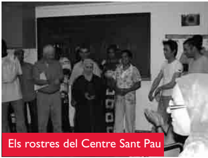
Els rostres del Centre Sant Pau

casa d'un amic... És en aquestes "petites" coses que, des de la nostra mirada creient, se'ns revela Déu.